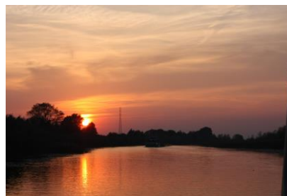
Zachód słońca na Pętli Żuławskiej

Oczywiście podobną aktywność wykazujemy także wspólnie z Radiem Olsztyn, gdzie 11 maja Zarząd Spółki udzielił kilku wywiadów, które będą sukcesywnie emitowane na antenie.