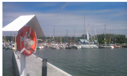
Port w Krynicy Morskiej